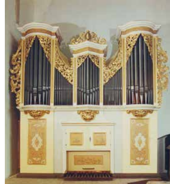
Freiberg Dom St. Marien Kleine Gottfried-Silbermann-Orgel