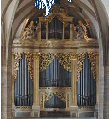
Freiberg Dom St. Marien Große Gottfried-Silbermann-Orgel