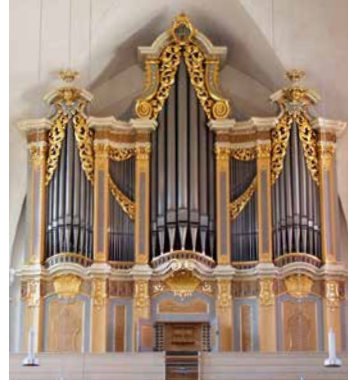
Freiberg St. Petrikirche Gottfried-Silbermann-Orgel